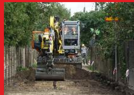
Budowa łącznika między drogą Budziska - Jasiorówka a DK 62 - Lipiec 2019 r.