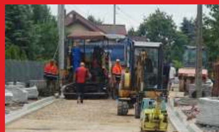
Przebudowa ul. Chopina w Łochowie - Lipiec 2019 r.