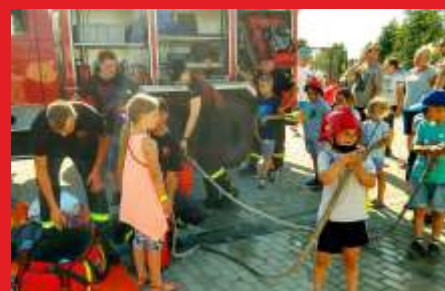
Festyn Rodzinny w Matalach zorganizowany przez Koło Gospodyń Wiejskich i Radę Sołecką. 30.06.2019 r.