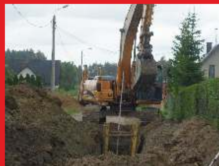
Budowa kanalizacji na ul. Różanej w Łochowie - Lipiec 2019 r.