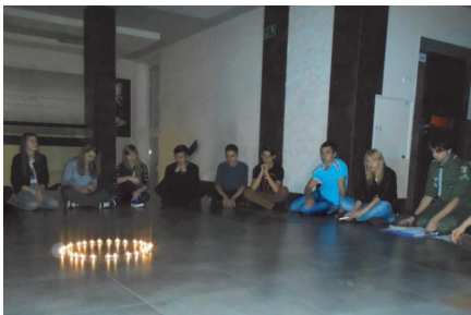
Harcerskie świecowisko z udziałem młodzieży ukraińskiej. 16 XI 2014 r.

W chłodny piątkowy wieczór 24 X odbyła się lochowska premiera filmu „Dzieci Kwatery Ł” w reżyserii Arkadiusza Gołębiowskiego. To wstrząsająca opowieść o ludziach, którzy czekają na odnalezienie szczątków członków swoich rodzin i przywrócenie im pamięci.