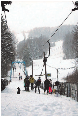
Karpaty w okolicach Kosowa.

Якби я був мером свого містечка Косів, я б зробив декілька змін і хотів би бачити його кращим в майбутньому.