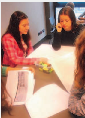
Зажęcia в Europejskim Centrum Solidarności w Gdańsku. Po prawej: Pelpin.

Каждый выjazd wiąże się z pewnymi oczekiwaniami. Co może zdziwić Polaków i Ukraińców w obcej kulturze? Zapytaliśmy o to uczestników projektu.