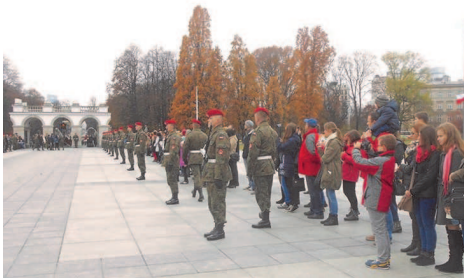
Ukraińcy z projektu „Pogranicza” zobaczyli uroczystą odprawę wart przed Grobem Nieznanego Żołnierza w Warszawie.

„Miasto 44” jest to jedna z najbardziej wyczekiwanych produkcji w ostatnim czasie. Film wzbudził w widzach wiele kontrowersji oraz silnych, czasem nawet skrajnych emocji.