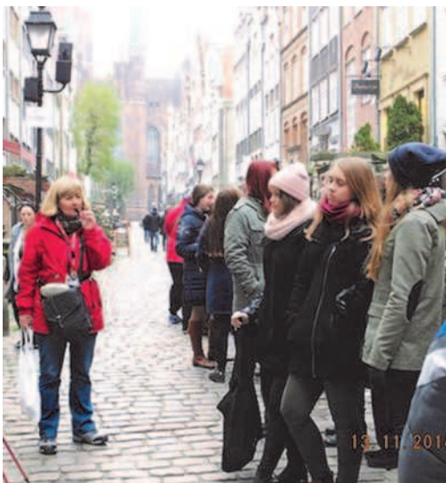
Zwiedzanie Gdańska przez uczestników projektu „Pogranicza”.

Résumé: Kiedy zostanie burmistrzem mojego miasta, postawię na rozwój rejonów górskich, zadbam o poziom ekologii miasta, odnowię obiekty basenowe, odnowię pomniki kultury ukraińskiej, wybuduję kompleksy sportowe i kino.